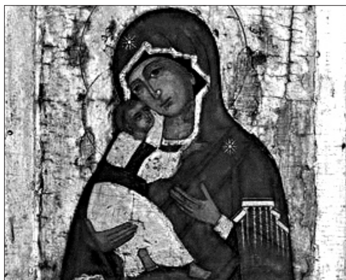
Владимирская икона Божией Матери

По преданию, евангелист Лука написал ее на доске стола Святого семейства. В 1155 году Андрей Боголюбский вывез святыню из Киева во Владимир (по нему она и получила название). Спасла Москву от Тамерлана.