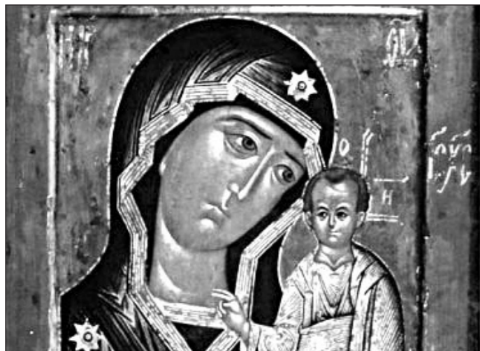
Казанская икона Божией Матери

В 1579 году после пожара Казани явилась на пепелище девочке Матроне Онучиной . В 1904 году вор выкрал ее из Богородицкого монастыря в Казани, ризу продал, икону сжег. Есть версия, что вор продал ее старообрядцам. Чудотворный список с иконы был у князя Пожарского в Смуту - сейчас он в Богоявленском соборе Москвы. Петр I молился перед образом накануне Полтавы , этот образ был с войсками в 1812 году.