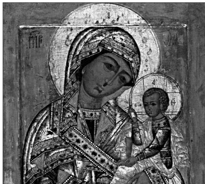
Смоленская икона Божией Матери

Написана евангелистом Лукой при жизни Пресвятой Богородицы. Император Византии Константин IX Мономах в 1046 году благословил образом дочь Анну на брак с князем Всеволодом Ярославичем . Их сын Владимир Мономах принес икону в Смоленск. Икона исчезла из Успенского храма Смоленска в 1943 году после оккупации. Особо чтимые списки - в Смоленске и в Новодевичьем монастыре в Москве.