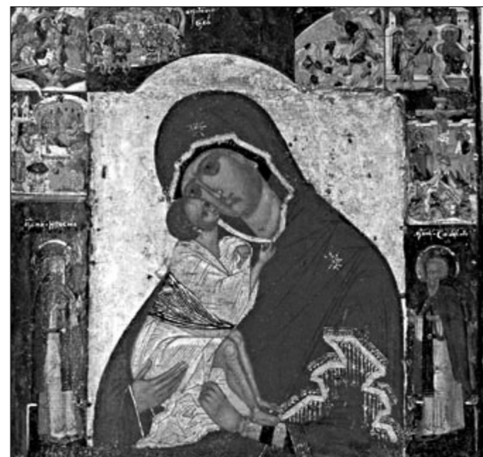
Донская икона Божией Матери

Написана Феофаном Греком . В день Куликовской битвы находилась с войсками, после боя была передана князю Дмитрию Донскому . Во время похода на Казань была в войске Ивана Грозного . Перед ее чтимым списком в Донском монастыре раз в 4 года Патриарх совершает чин мирования. С 1919 года хранится в Третьяковской галерее . Раз в год ее отдают для крестного хода в Донской монастырь .