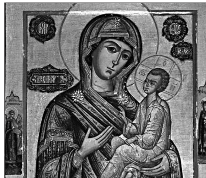
Тихвинская икона Божией Матери

По преданию, написана евангелистом Лукой и хранилась во Влахернском храме . В 1383 году была чудесно явлена на берегу речки Тихвинки близ Новгорода . Хранилась в построенном для нее Тихвинском монастыре . Список с нее присутствовал при подписании Столбовского мира . Во время войны была вывезена в США. В 2004 году по завещанию ее хранителя возвращена в обитель.