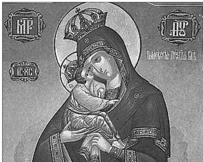
Почаевская икона Божией Матери