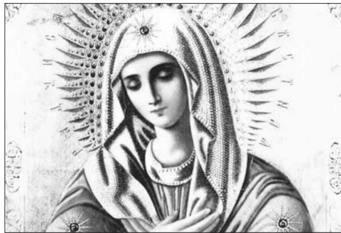
«Умиление» икона Божией Матери

Келейная икона Серафима Саровского , перед ней он скончался в 1833 году. Серафим называл ее « Всех радостей Радость », елеем от лампы исцелял болящих. Икона была спасена монахинями при разграблении обители, передана патриарху Алексию II . Хранится в патриарших покоях в Чистом переулке , в пятую неделю Великого поста ее приносят в Богоявленский храм в Елохове (Москва).