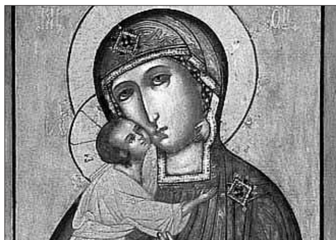
Феодоровская икона Божией Матери

По преданию, написана евангелистом Лукой , явилась в 1256-м под Костромой , находилась в местном храме Феодора Стратилата . Главная святыня дома Романовых , ею был «умолен» на царство Михаил Романов , в ее честь все царицы иностранного происхождения принимали отчество Федоровна . Председательствует на церковных соборах. Хранится в Богоявленско-Анастасином кафедральном соборе Костромы .