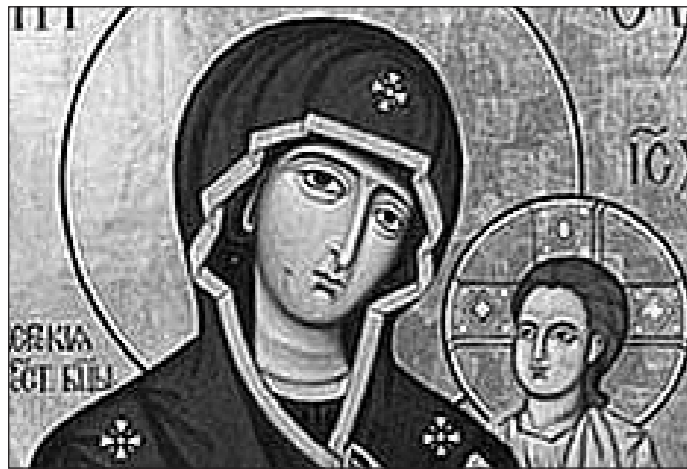
Иверская икона Божией Матери

Написана евангелистом Лукой . В 999 году икона явилась афонским монахам на огненном столбе в морских водах. Хранится в надвратной часовне Иверского монастыря на Афоне . В 1648 году ее список прибыл в Россию . Часовню для него в 1791 году выстроил Матвей Казаков . Сейчас в восстановленной часовне хранится новый список с афонского образа. Почитается как хранительница Москвы.