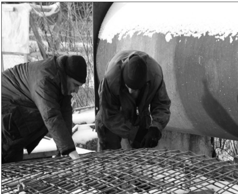
Рабочие плетут сетку для купола

ее частью, с красивым капитальным ограждением, с прекрасно устроенной территорией: дорожками, возможно, с прудом — есть разные и очень интересные идеи. Все это, быть может, с какими-то незаконченными деталями, но должно быть в основном построено.