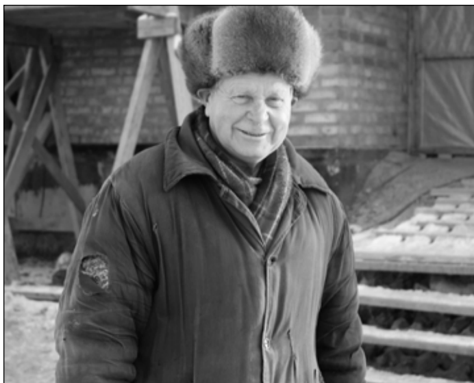
Работаем с улыбкой