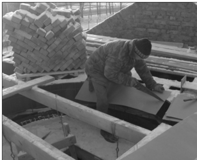
Место для купола